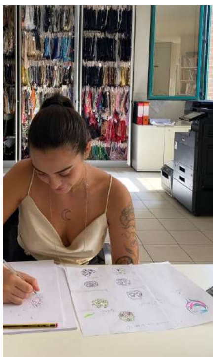
DUE STUDENTESE DELL'EXCHANGE PRO- GRAM DALLA SPAGNA NELLA MATERIOTECA DELL'HUB IID