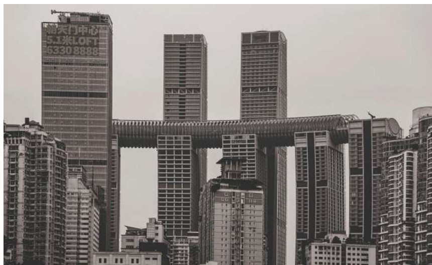
IL DISTRETTO INDUSTRIALE HIGH-TECH DI CHONGQING, IN CINA.

L'area si distingue per una solida base industriale e un investimento in R&S pari al 4,6% del PIL distrettuale, superando significativamente la media regionale. Grazie a infrastrutture d'avanguardia e a una densità di brevetti d'invenzione tra le più alte del Paese, il Comitato agisce come motore strategico per la modernizzazione tecnologica e come interlocutore istituzionale chiave per la cooperazione industriale e accademica su scala globale.